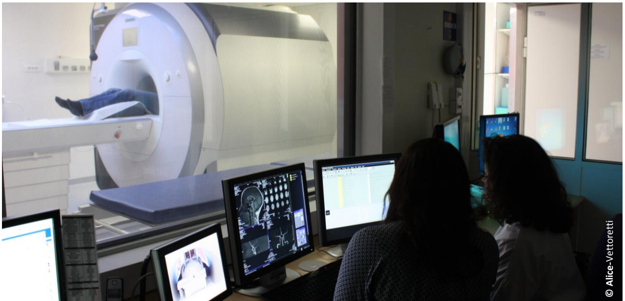
L'IRM Siemens Prisma équipe la plateforme de recherche Neurinfo depuis février 2018 -

Un nouvel Imageur par Résonance Magnétique (IRM) est installé au CHU de Rennes, au sein de la plateforme Neurinfo de l'Université de Rennes 1. Il permet d'acquérir plus de données en moins de temps et d'observer les tissus humains avec plus de détails.